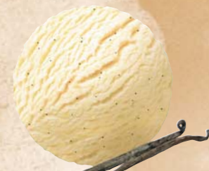
Vanille mit Vanillesamen