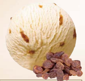
Jamaika mit Sultaninen